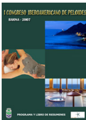
Figura 1 – I Congreso Iberoamericano de Peloides