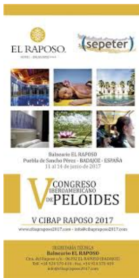
Figura 5 – V Congreso Iberoamericano de Peloides