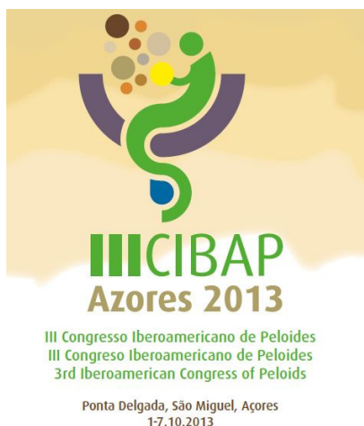
Figura 3 – III Congreso Iberoamericano de Peloides